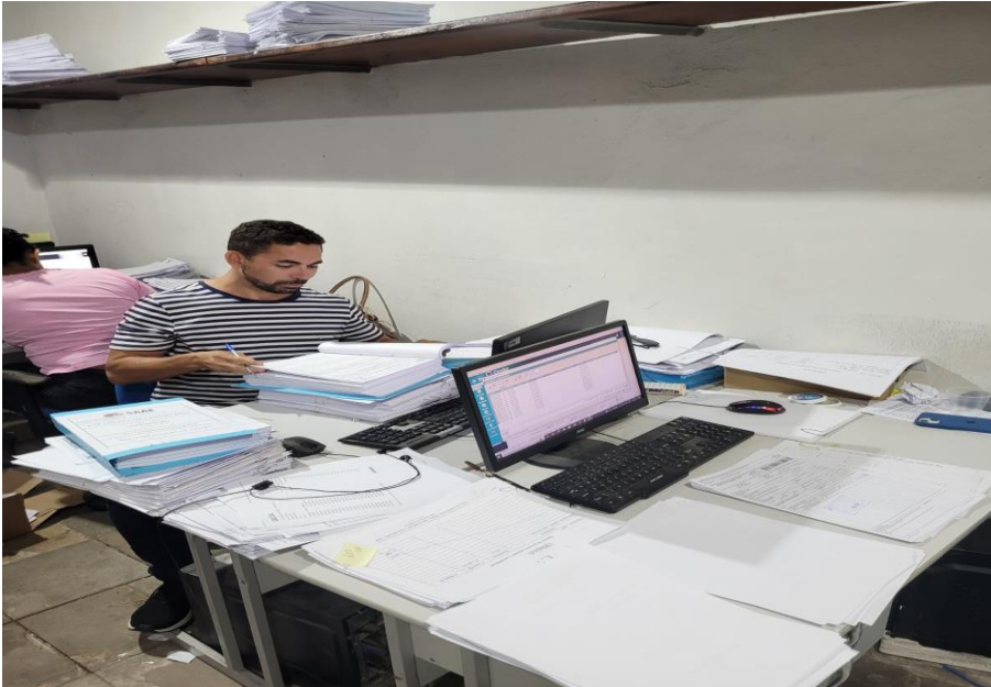
Anexo 1 – Conferência de documentos contábeis.