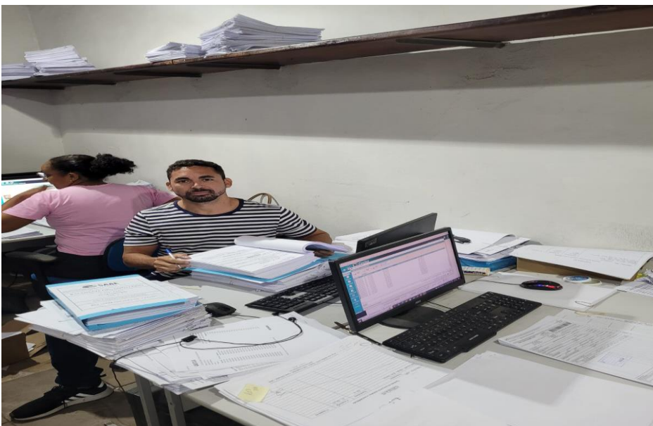
Anexo 4 – Atividades de triagem documental e lançamentos.